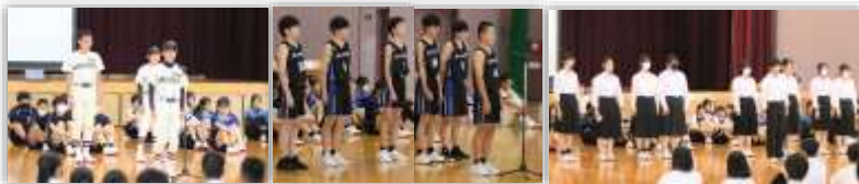
各部の3年生部員を中心にした決意表明とパフォーマンス。左から野球部、バスケットボール部、吹奏楽

各部代表の決意表明の後、1・2年生の代表者が「自分たちを常に引っ張って来てくれた。緊張感の中でも冷静さを失わない頼もしさがあった。全力でプレーし演奏してほしい」と激励の言葉を送りました。